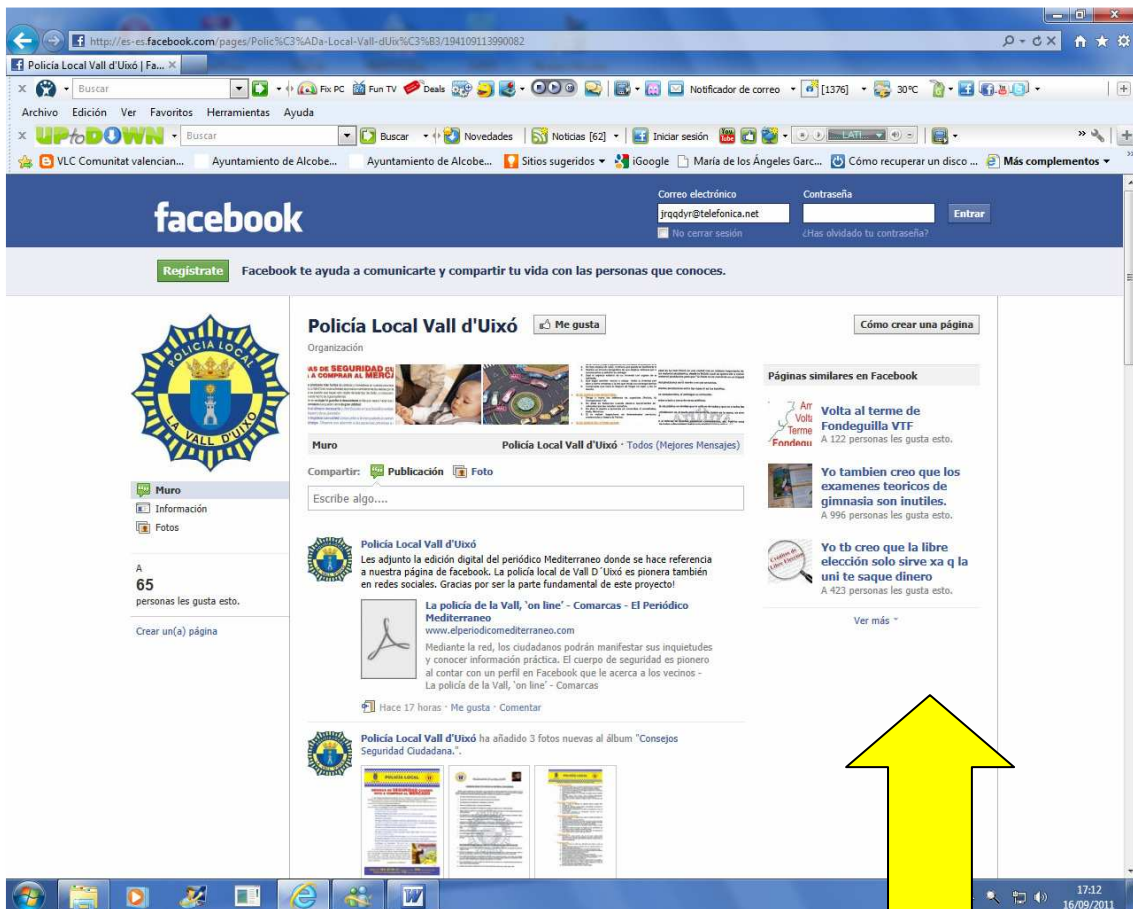
Facebook Policía Local de La Vall d'Uixó